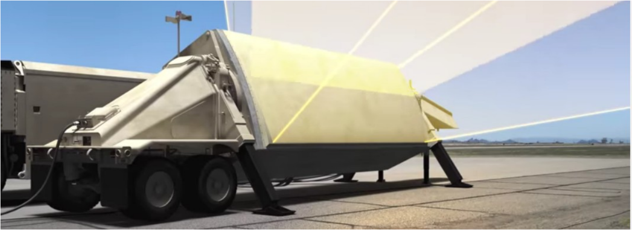
X-Band-Radar wie in Kürecik, Türkei (Screenshot aus https://www.youtube.com/watch?v=ae5VmVwfWmk )

5. Lüge: Der NATO-Raketenabwehrschild ist eigentlich ein US-Raketenabwehrschild. Denn die bis jetzt existierenden Komponenten – das X-Band-Radar in der Türkei (s. http://www.luftpost-kl.de/luftpost-archiv/LP_12/LP05412_020312.pdf ), die Aegis-Raketenbasis in Rumänien ( http://www.luftpost-kl.de/luftpost-archiv/LP_16/LP00416_080116.pdf ) und die vier im spanischen Rota stationierten, ebenfalls mit dem Aegis-System ausgerüsteten Lenkwaffenzerstörer (weitere Infos dazu unter http://www.luftpost-kl.de/luftpost-archiv/LP_13/LP02314_090214.pdf ) gehören und unterstehen den US-Streitkräften (s. http://www.nato.int/nato_static_fl2014/assets/pdf/pdf_2016_07/20160630_1607-factsheet-bmd-en.pdf ) und sind allenfalls an die NATO ausgeliehen.