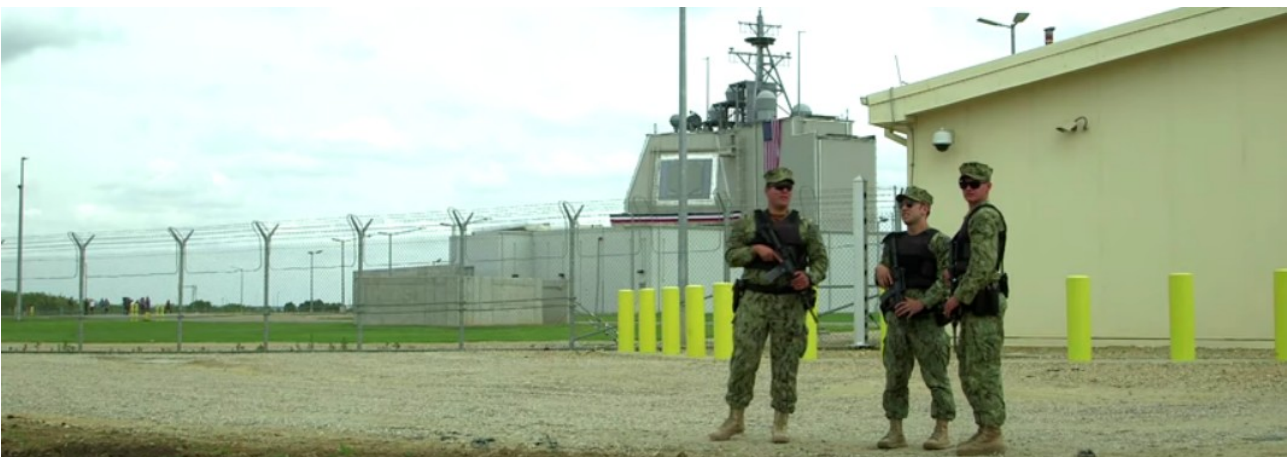
Aegis-Raketenbasis in Rumänien