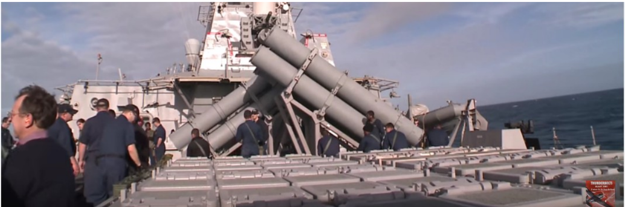
Aegis-Zerstörer mit Raketensilos im Vordergrund

5. Lüge: Der NATO-Raketenabwehrschild ist eigentlich ein US-Raketenabwehrschild. Denn die bis jetzt existierenden Komponenten – das X-Band-Radar in der Türkei (s. http://www.luftpost-kl.de/luftpost-archiv/LP_12/LP05412_020312.pdf ), die Aegis-Raketenbasis in Rumänien ( http://www.luftpost-kl.de/luftpost-archiv/LP_16/LP00416_080116.pdf ) und die vier im spanischen Rota stationierten, ebenfalls mit dem Aegis-System ausgerüsteten Lenkwaffenzerstörer (weitere Infos dazu unter http://www.luftpost-kl.de/luftpost-archiv/LP_13/LP02314_090214.pdf ) gehören und unterstehen den US-Streitkräften (s. http://www.nato.int/nato_static_fl2014/assets/pdf/pdf_2016_07/20160630_1607-factsheet-bmd-en.pdf ) und sind allenfalls an die NATO ausgeliehen.