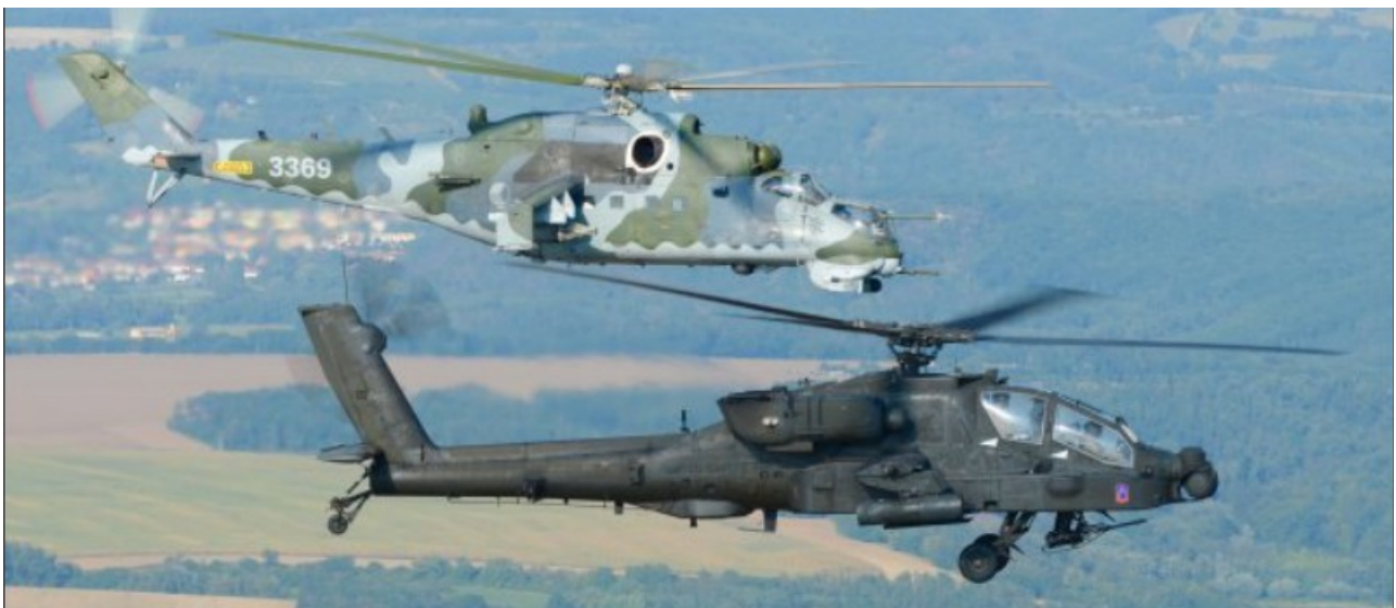
Apache AH-64 (unten) und Hind Mi-24 im Formationsflug

TRUPPENÜBUNGSPLATZ BOLETICE, Tschechien – Vier Apache-Kampfhubschrauber des Typs AH-64 (s. https://de.wikipedia.org/wiki/Boeing_AH-64 ) und 60 Mann Unterstützungspersonal vom 2. Bataillon des 159. Heeresfliegerregiments (der 12 th Combat Aviation Brigade / CAB in Ansbach) nahmen zwischen dem 7. und 18. September an einem neuntägigen Manöver mit Joint Terminal Attack Controllers / JTACs (am Boden befindlichen Einweisern für Luftangriffe, weitere Infos dazu s. unter http://www.luftpost-kl.de/luftpost-archiv/LP_10/LP20010_151010.pdf ) teil, bei dem sie auch mit scharfer Munition schossen.