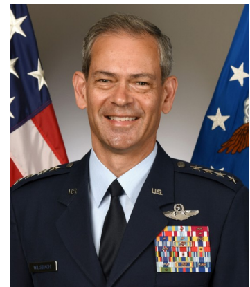
General Kenneth Wilsbach

Wilsbach warf China auch feindliche Aktivitäten gegenüber Kriegsschiffen und Militärflugzeugen der USA außerhalb der vom Seerecht festgelegten 12-Meilen-Zone (22,2 km) vor.