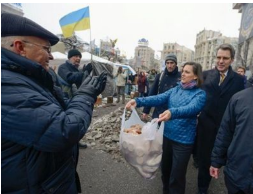
Ebenfalls entnommen aus http://www.voltairenet.org/article181535.html

Auch das jüngste in Kiew aufgeführte Schauspiel wurde wieder von der professionellen CIA-Hydra "Endowment for Democracy" (einer US-Stiftung zur "Förderung der Demokratie", s. http://de.wikipedia.org/wiki/National_Endowment_for_Democracy und http://de.wikipedia.org/wiki/European_Endowment_for_Democracy ) inszeniert, die von Soros finanziert und von Sharp dirigiert wird und schon in der ersten so genannten "Orangen Revolution" im Jahr 2004 den Sturz einer ukrainischen Regierung bewirkt hat. Diesmal hat sie aber nicht nur den ukrainische Präsidenten Janukowitsch, sondern auch den russischen Präsidenten Vladimir Putin im Visier.