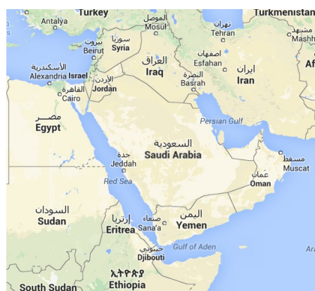
Kartenausschnitt aus Google Maps

Während das saudische Königshaus den Jemen schon immer als untergeordnete Provinz und Teil seiner Einflussphäre betrachtet hat, wollen die USA auch weiterhin die Meerenge Bab Al-Mandab (weitere Infos dazu s. http://de.wikipedia.org/wiki/Bab_al-Mandab ), den Golf von Aden und die Sokotra-Inseln (s. http://de.wikipedia.org/wiki/Sokotra_%28Insel%29 ) kontrollieren. Der Bab al-Mandab ist ein wichtiges strategisches Nadelöhr für den internationalen Seehandel und den Öltransport aus dem Persischen Golf über das Arabische und das Rote Meer ins Mittelmeer. Diese Meerenge ist ebenso wichtig für die Seeschifffahrt und den Handel zwischen Afrika, Asien, und Europa wie der Suezkanal.