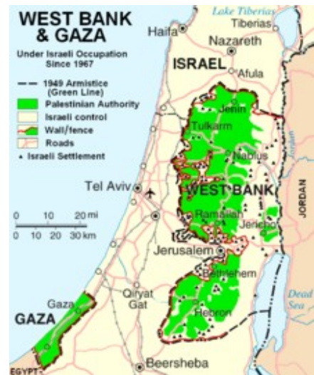
Entnommen aus http://de.wikipedia.org/wiki/Westjordanland

Wohl auch deshalb lehnten die Palästinenser und die arabischen Länder die Zwei-Staaten-Lösung ab und wollten ein ungeteiltes Palästina erhalten. Am 14. Mai 1948 endete das britische Mandat über Palästina, und noch am selben Tag riefen die zugewanderten jüdischen Siedler den Staat Israel aus. Als in der darauffolgenden Nacht Streitkräfte aus Ägypten und Syrien in den voreilig gegründeten jüdischen Teilstaat einfielen, begann der bis Januar 1949 dauernde so genannte Israelische Unabhängigkeitskrieg, in dem sich Israel weitere, von der UN-Generalversammlung den Palästinensern zugesprochene Gebiete aneignete. Den Palästinensern blieben nur der von Ägypten besetzte Gaza-Streifen und die von Jordanien besetzte West Bank. Seit dem Sechstagekrieg 1967 (s. http://de.wikipedia.org/wiki/Sechstagekrieg ) werden auch die West Bank und der Gaza-Streifen von der israelischen Armee kontrolliert