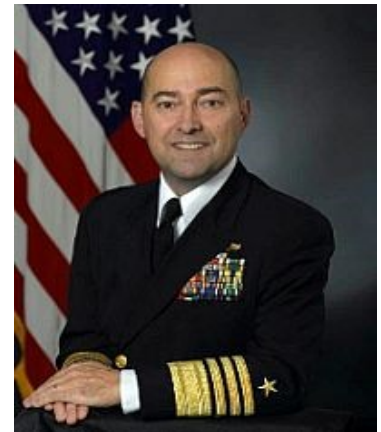
Admiral James G. Stavridis Foto und Biografie:

(Wir haben den Artikel komplett übersetzt und mit Anmerkungen in Klammern versehen.)