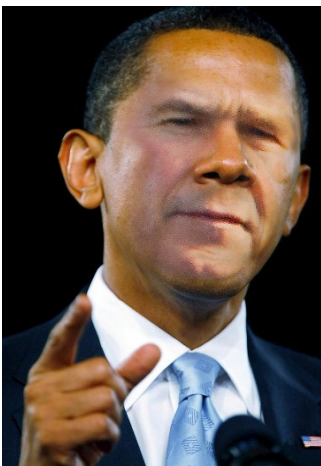
Präsident George Obama

Präsident Barack Obama will die Ausgaben für das US-Militär im Haushaltsjahr 2010 um 20,4 Milliarden Dollar erhöhen, er verlangt aber eine rigorose Beschneidung des verschwenderischen Pentagon-Beschaffungsprogramms.