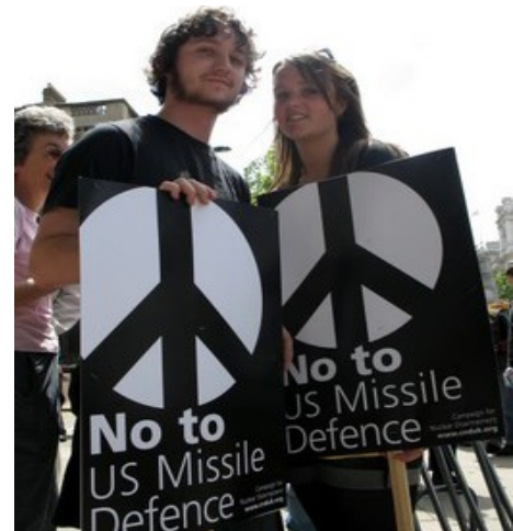
Protest gegen die Einbeziehung Großbritanniens in den US-Raketenschild

("Wir begrüßen die kürzlich veröffentlichte gemeinsame Erklärung der Führungen der Bruderparteien der Labour Party in Polen und in der Tschechischen Republik zu dem US-Raketenschild. Sie haben darin ihr Befremden über den Mangel an Konsultationen und die fehlende Information der Öffentlichkeit durch ihre Regierungen zum Ausdruck gebracht;) auch wir fordern die Regierung des U.K. (des Vereinigten Königreichs) auf, erneut in eine Debatte einzutreten, die es den Mitgliedern des Parlaments ermöglicht, sich öffentlich mit den Plänen zur Beteiligung des U.K. an dem US-Raketenschild zu beschäftigen," heißt es in der Stellungnahme. (Der von uns ergänzte komplette Text der Erklärung ist nachzulesen auf der Website der britischen Campaign for Nuclear Disarmament / CND http://www.cnduk.org/index.php/campaigns/missile-defence/us-missile-defence-poll.html . Dort sind auch die Namen der protestierenden Labour-Abgeordneten und die gemeinsame Erklärung der polnischen und tschechischen Bruderparteien der Labour Party abgedruckt.)