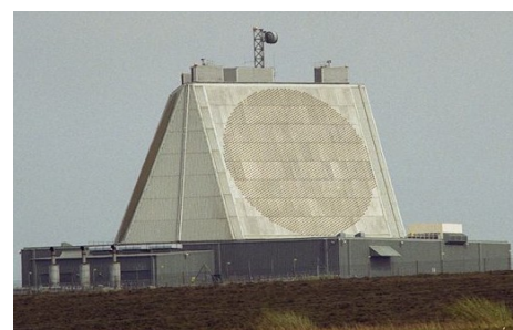
Radaranlage Fylingdales (Wikipedia)

Wie wir bereits in der LUFTPOST 057/08 berichtet haben, sollen auch Radar- und Kommunikationseinrichtungen in Großbritannien in den US-Raketenschild integriert werden. Damals ging es nur um die nördlich der Stadt Leeds gelegene US-Abhörstation Menwith Hill, jetzt wird auch noch die britische Radarstation Fylingdales südlich von Whitby genannt.