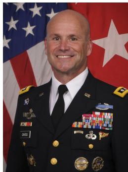
Lt. Gen. Cavoli

Cavoli teilte mit, Brig Gen. Clark werde während ihres Kommandos bei der U.S. Army Europe für mehrere Bereiche die Verantwortung übernehmen, auch für die Army Reserve Engagement Cell (die Integration von Reservisten, weitere Infos dazu unter https://www.army.mil/article/161738/arecs_ensure_us_army_reserve_is_engaged_on_the_world_stage ).